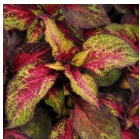
Rose to Lime Magic