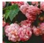
White Pink Picotee