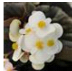
White Bronze Leaf