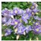
Early Sky Blue