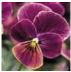
アンティーク シェード!