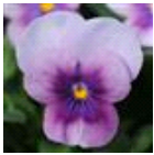
オーキッドローズ ビーコン