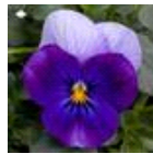
バイオレット ビーコン

2020年度に新品種としてローズウィングが加まりました。 バイオレットビーコンはXPシリーズからソルベシリーズに移行しました。 レモンベリーソワール、イエローバイオレットジャンプアップは終売となります。