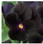
ブラックデライト