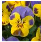
イエローブルー ジャンプアップ