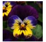
ミッドナイトグロー