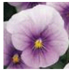
アイシブルー ローズ