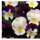
ベリーズアンド クリームミックス