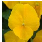
ゴールデンイエロー