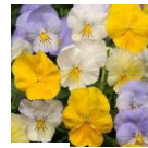
パステルミックス