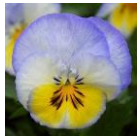
ブルーベリーソワール インプ (右)