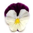
バイオレット ウィング