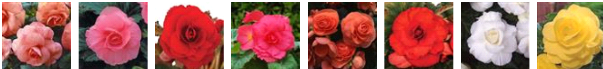
ピーチ ピンク レッド ローズ サーマン スカーレットオレンジ ホワイト イエロー