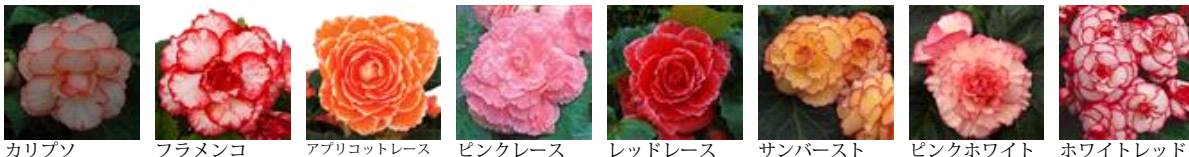
カリブソ フラメンコ アプリコットレース ピンクレース レッドレース サンバースト ピンクホワイト ホワイトレッド