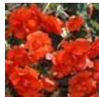
スカーレットオレンジ