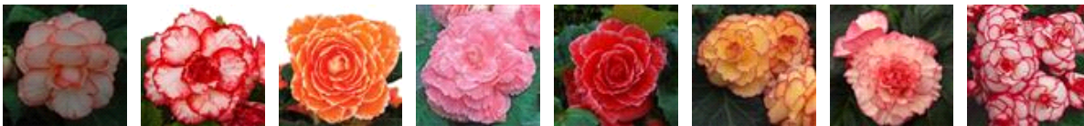
カリブソ フラメンコ アプリコットレース ピンクレース レッドレース サンバースト ピンクホワイト ホワイトレッド