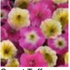
Sweet Taffy Karışımı